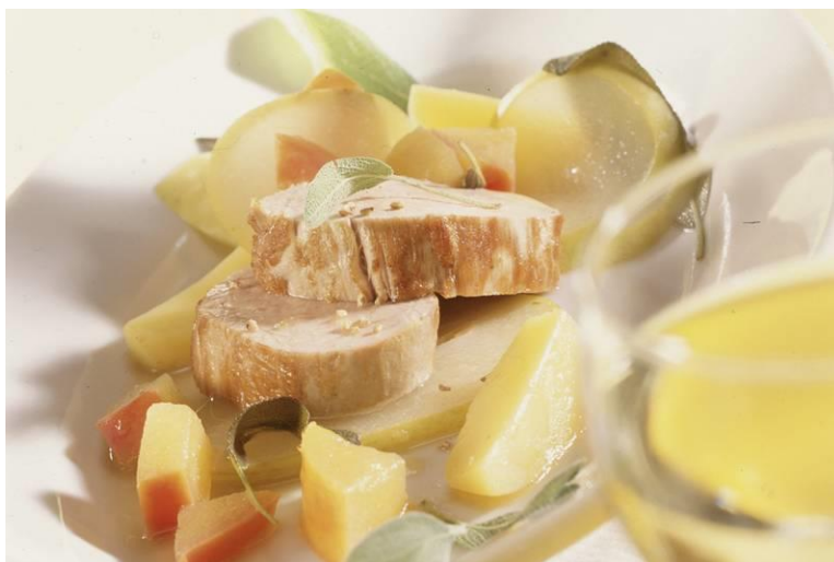
Bladzijde 267, Die Quitte

Deze mevrouw heeft de kweeper weer op de kaart gezet. In Nederland nog niet zo bekend, maar zoals Goethe al eens zei: in Holland gebeurt alles 50 jaar later.